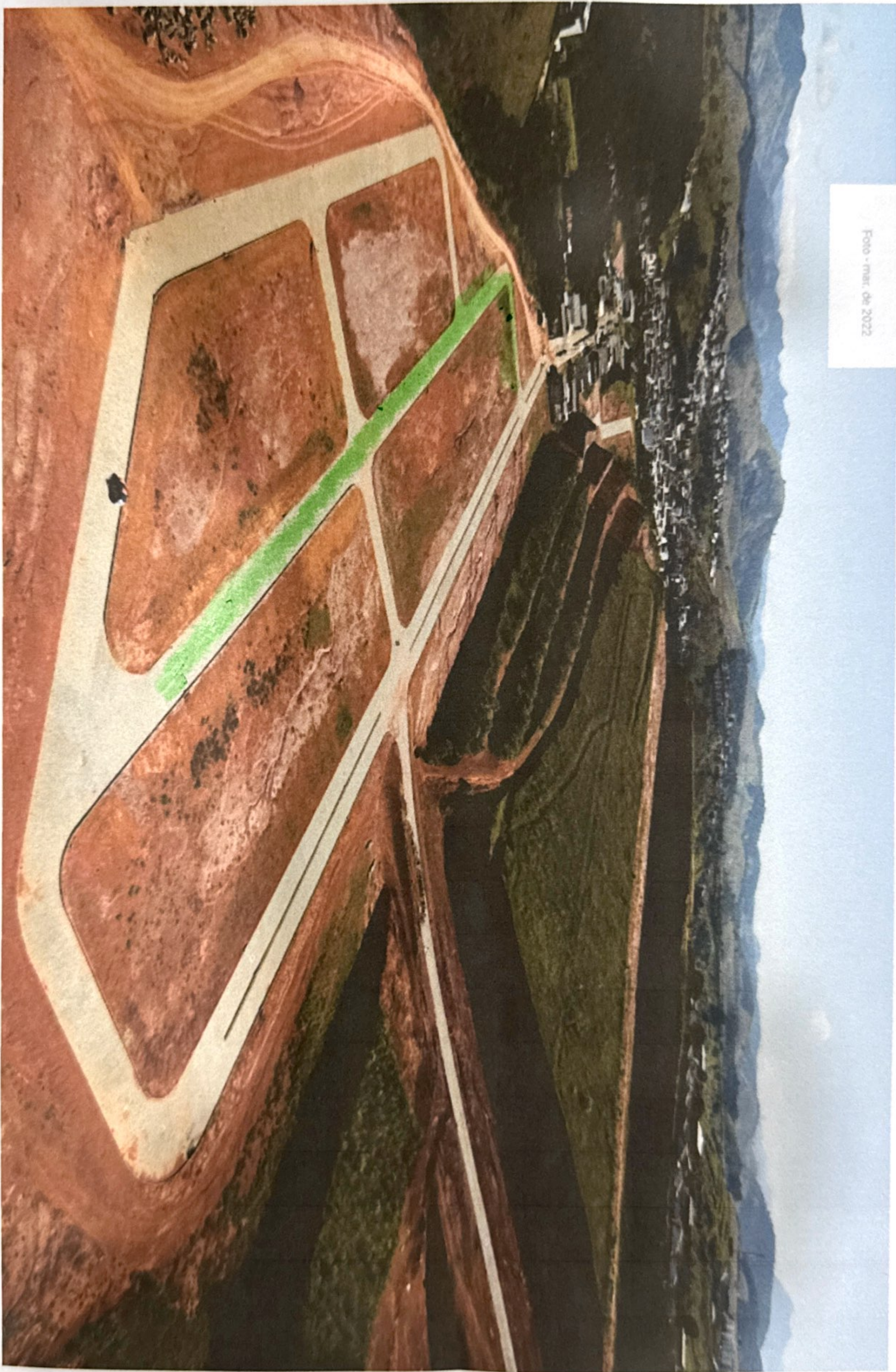
Foto - mar. de 2022